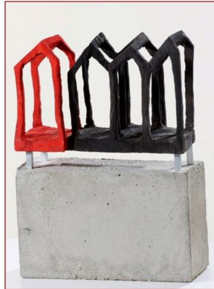
Objektgruppe Haus Kiefer / Pappel Objekthöhe ca. 20 cm