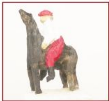
ohne Titel Pappel Objekthöhe 160 cm