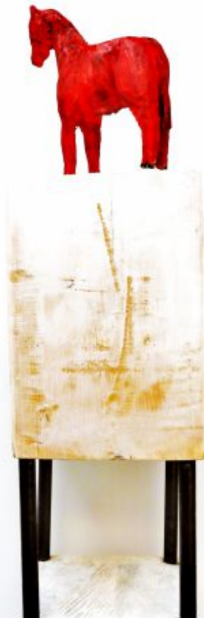
rotes Pferd Lerche Objekthöhe 115 cm