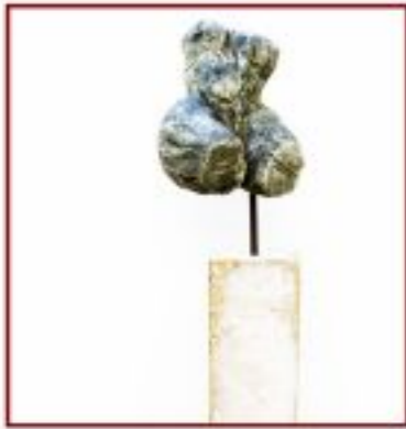
Torso Pappel auf Betonsäule Objekth. 10 cm, Gesamth. 175 cm