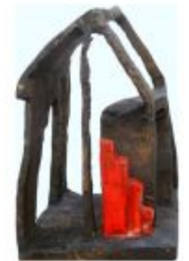
aus den Fugen geraten