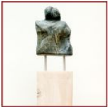
innig.. Buche auf Kiefernholzstele Objekth. 8 cm, Gesamth. 130 cm