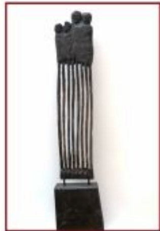
Der Familienweg Rotbuche Gesamthöhe 100 cm