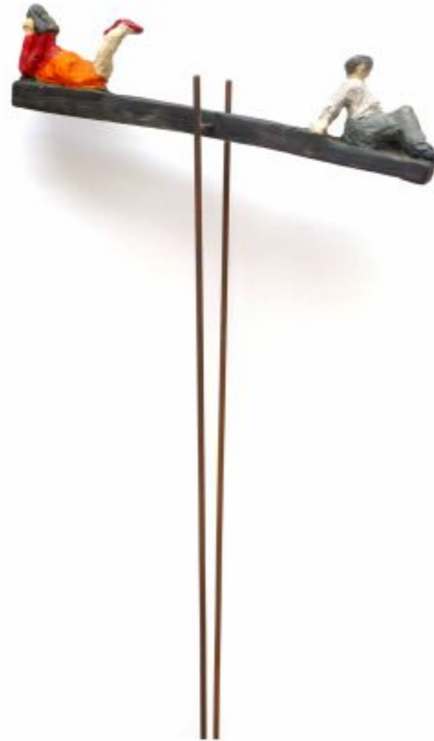
Gewichtsverlagerung Pappel auf Stahlstangen Objekthöhe 10 cm Gesamthöhe 120 cm