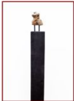
ohne Titel Rotbuche Objekthöhe 6 cm, Gesamthöhe 80 cm