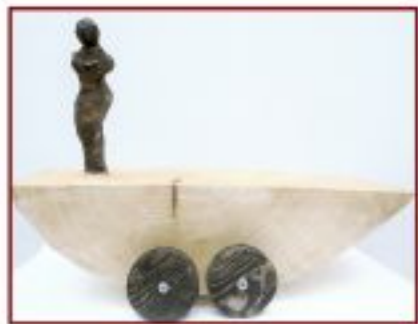
große Bühne Linde Objekthöhe 24 cm