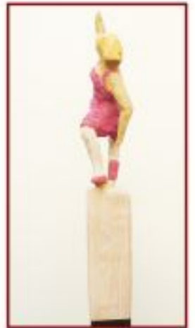
Tanz Kiefer auf Stahlsäule Objekthöhe 20 cm Gesamthöhe 140 cm