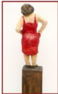
Abwarten.. Lerche auf Metallfuß Gesamthöhe 54 cm