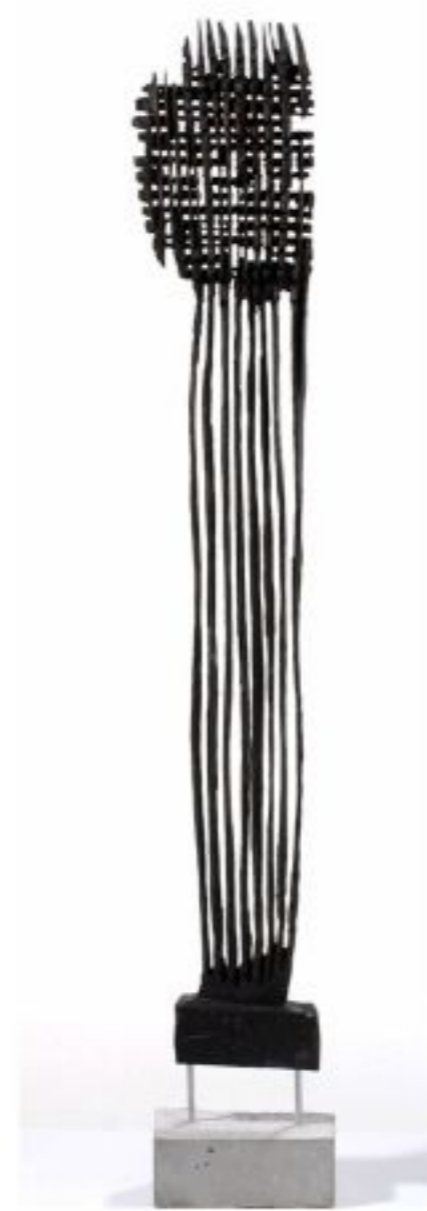
ohne Titel Rotbuche auf Betonsockel Gesamthöhe 110 cm