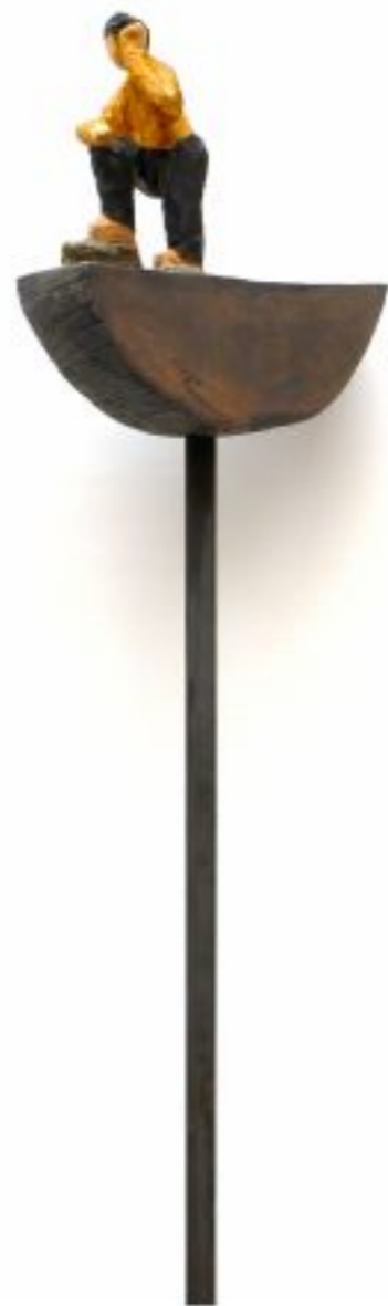
Denker Linde auf Stahlstange Objekthöhe 30 cm, Gesamthöhe 170 cm