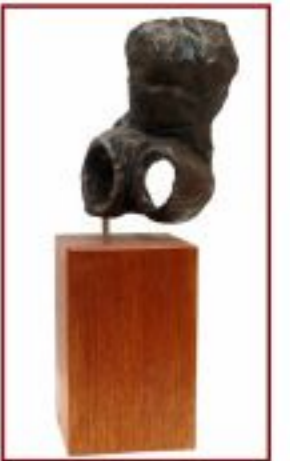
nur eine Hülle Pappel auf Teakholzsockel Gesamthöhe 20 cm