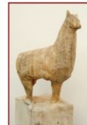
Alpaka 1-3 Pappel Objekthöhe 140 cm