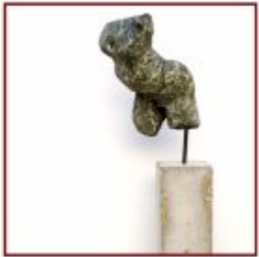
Torso Pappel auf Betonsockel Objekth. 10 cm, Gesamth. 175 cm