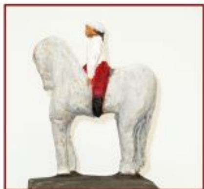
erste Reitstunde Kiefer auf Betonssockel Objekthöhe 14 cm Gesamthöhe 32 cm