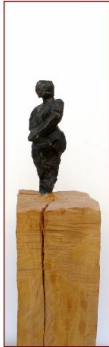
Tanz.. Eiche Objekthöhe 60 cm