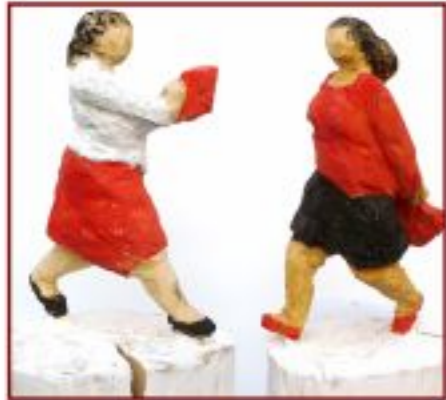
ohne Titel Wacholder Objekthöhe 58 cm