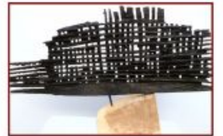
ohne Titel Buche auf Lindensockel Gesamthöhe 30 cm