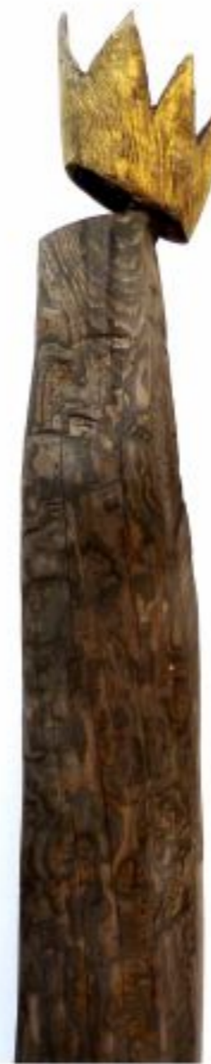
die Kluge Pappel Objekthöhe 130 cm