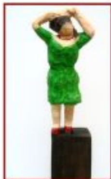
letzter Schliff.. Lerche auf Metallfuß Gesamthöhe 54 cm