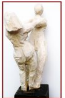
ohne Titel Pappel Objekthöhe 130 cm