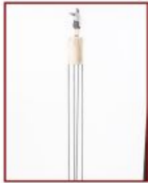
sieh dort... Wacholder Objekthöhe 30 cm Gesamthöhe 130 cm