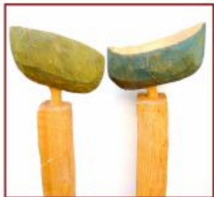
das Leben Pappel Objekthöhe 120 cm