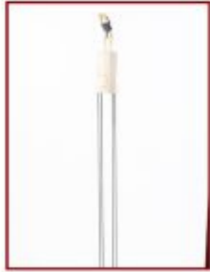
fit... Wacholder Objekthöhe 30 cm Gesamthöhe 130 cm