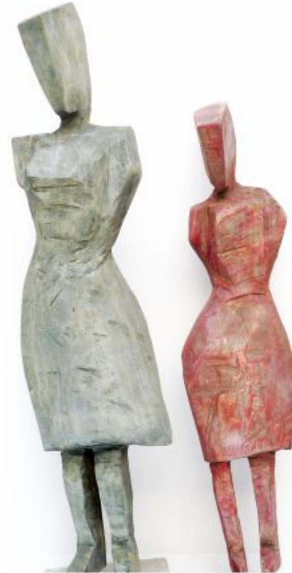
ohne Titel Pappel auf Betonsockel Gesamtoobjekthöhe 90 und 100 cm