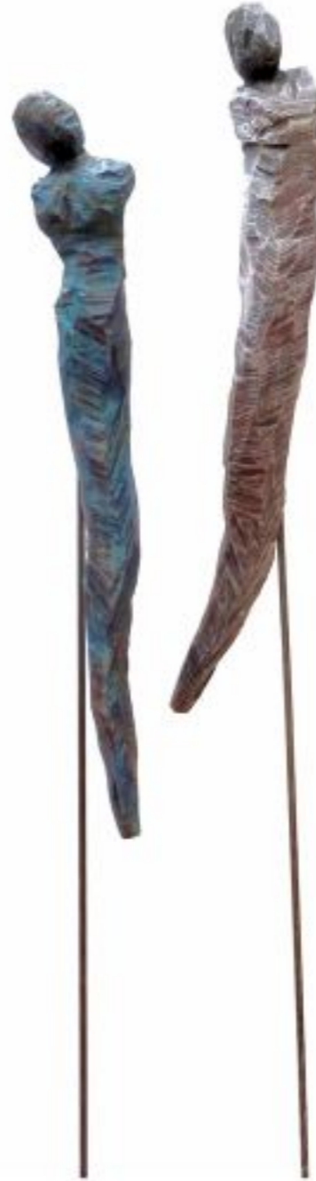
Bewegung verschiedene Hölzer bemalt Gesamthöhe an Stahlstange 150 - 160 cm