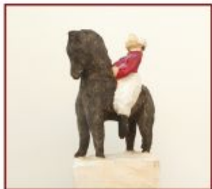
ohne Titel Pappel Objekthöhe ca 160 cm