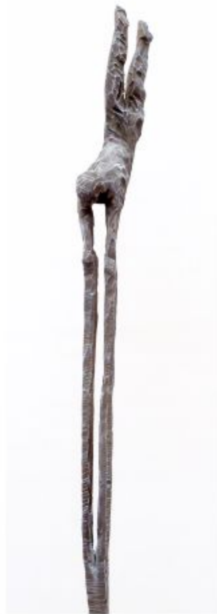
von oben herab.. Objekthöhe 120 cm Gesamthöhe 170 cm