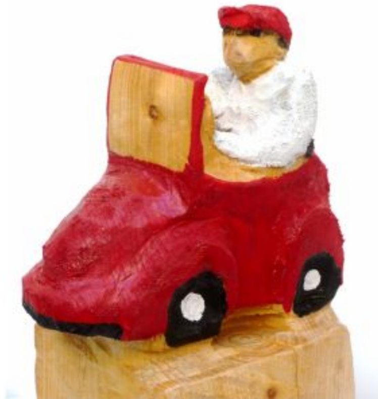
Mein Auto und ich Kiefer Objekthöhe 28 cm