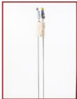
Konflikt? Wacholder Objekthöhe 30 cm Gesamthöhe 130 cm