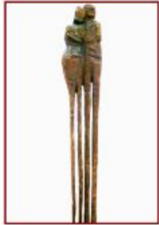
gemeinsam, lange Wege gehen Rotbuche Gesamthöhe 100 cm