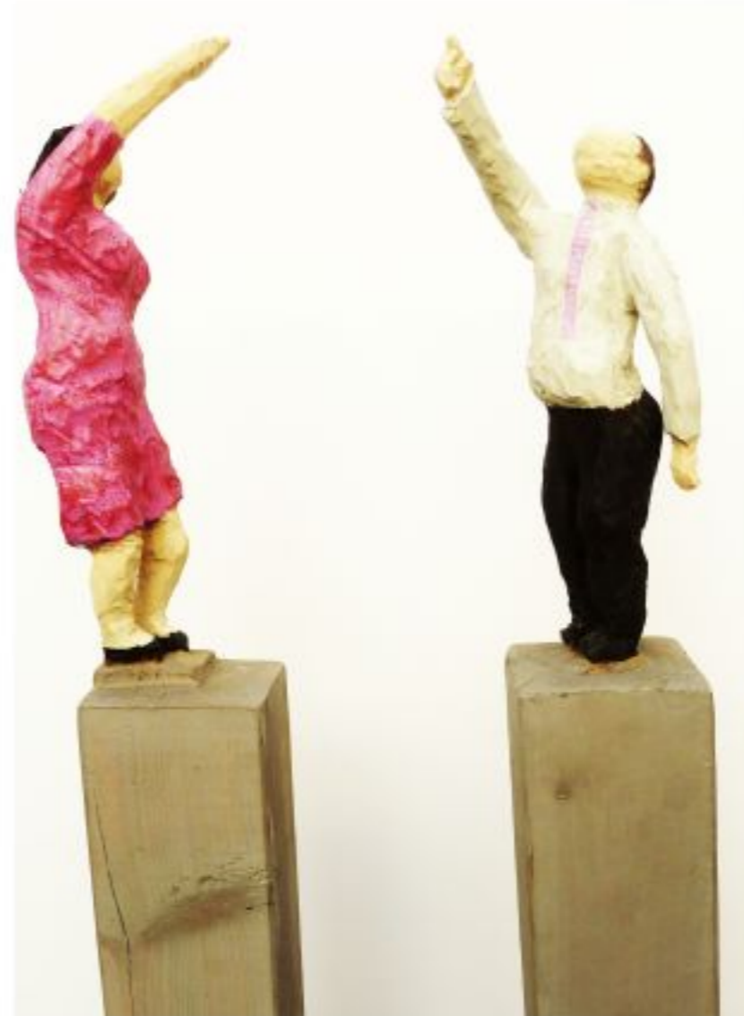
was geschieht da? Kiefer auf Stahlsäule Objekthöhe 30 cm, Gesamthöhe 140 cm