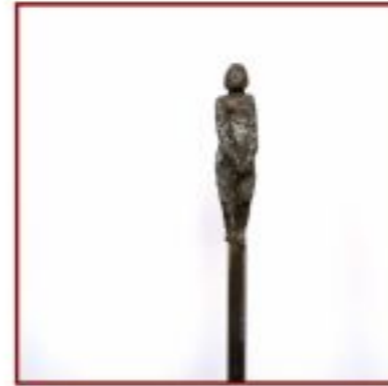
drei Figurinen Pappel geschwärzt auf Stahlstange Objekthöhe 13 cm, Gesamthöhe 175cm