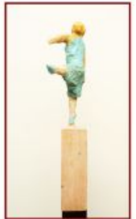
Tanz Kiefer auf Stahlsockel Objekthöhe 20 cm Gesamthöhe 140 cm