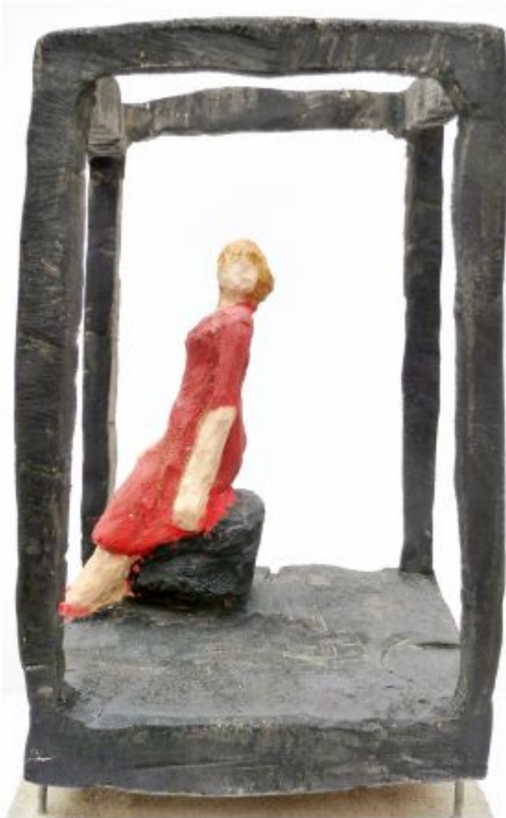
Objektgruppe im Raum Pappel Objekthöhe 26 cm