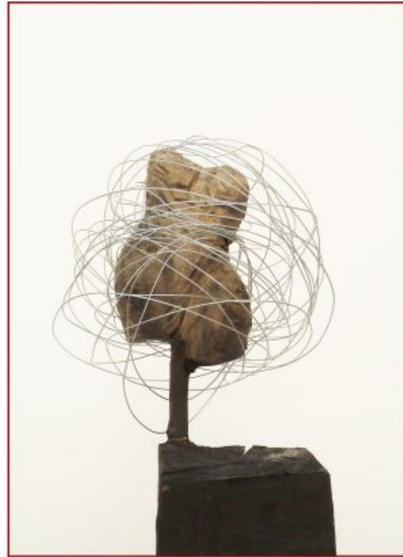
umgarnt.. Pappel Silberdraht Objekthöhe 30 cm