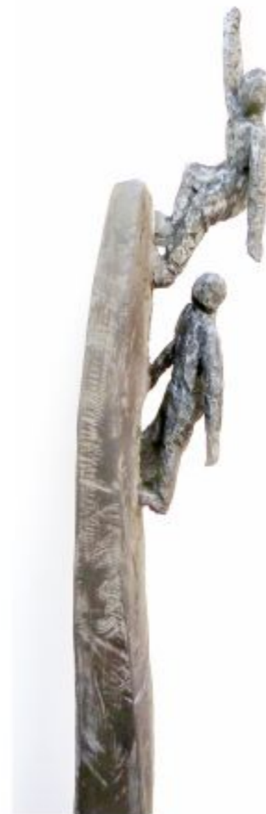
auf und davon... Pappel Objekthöhe 165 cm