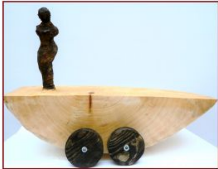
große Bühne.. Linde, Objekthöhe 24 cm