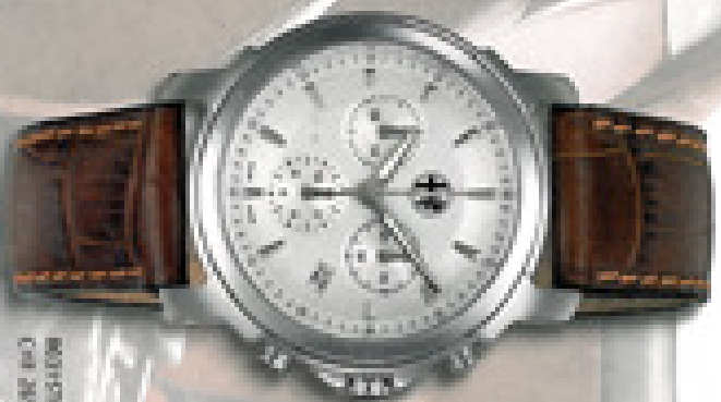
8011124 CHF 209.-