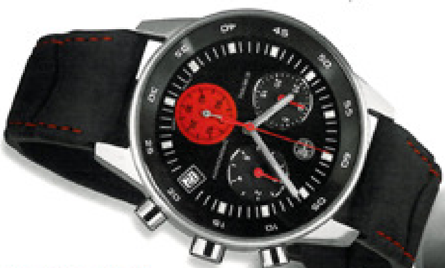
7840111 CHF 184.-