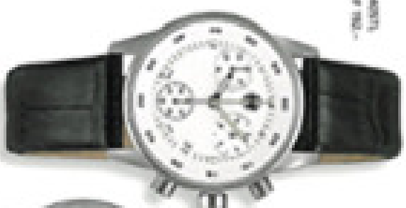
Modello COP 139 -