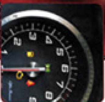
ROMEO COP 119.-