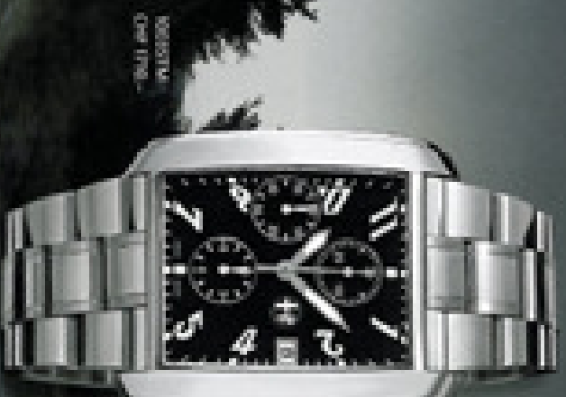
SWISSMA OHR 1718

Das Automatische Chronographen Uhrenmodell (ETA Kaliber 775) verfügt über ein herausragendes Design, inspiriert von der eleganten Ästhetik der Golfclubs. Die Uhr ist ein Meisterwerk der Schweizer Uhrenherstellung und verfügt über ein herausragendes Design.