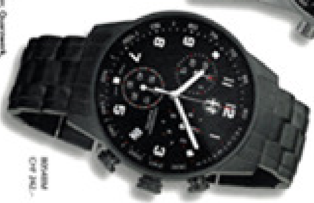
ROMEO COP 104.-