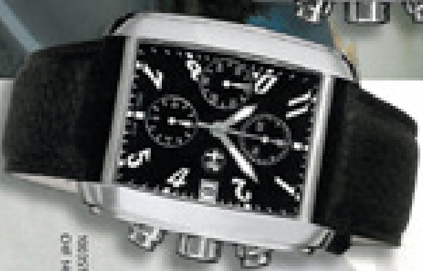
SWISSMA OHR 1818