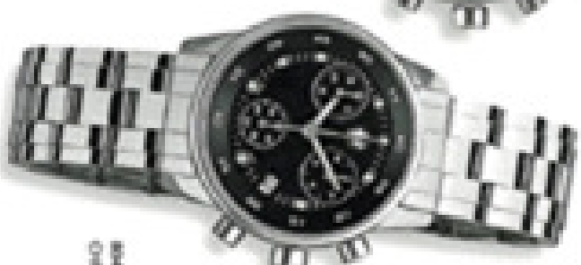
Modello COP 139 -