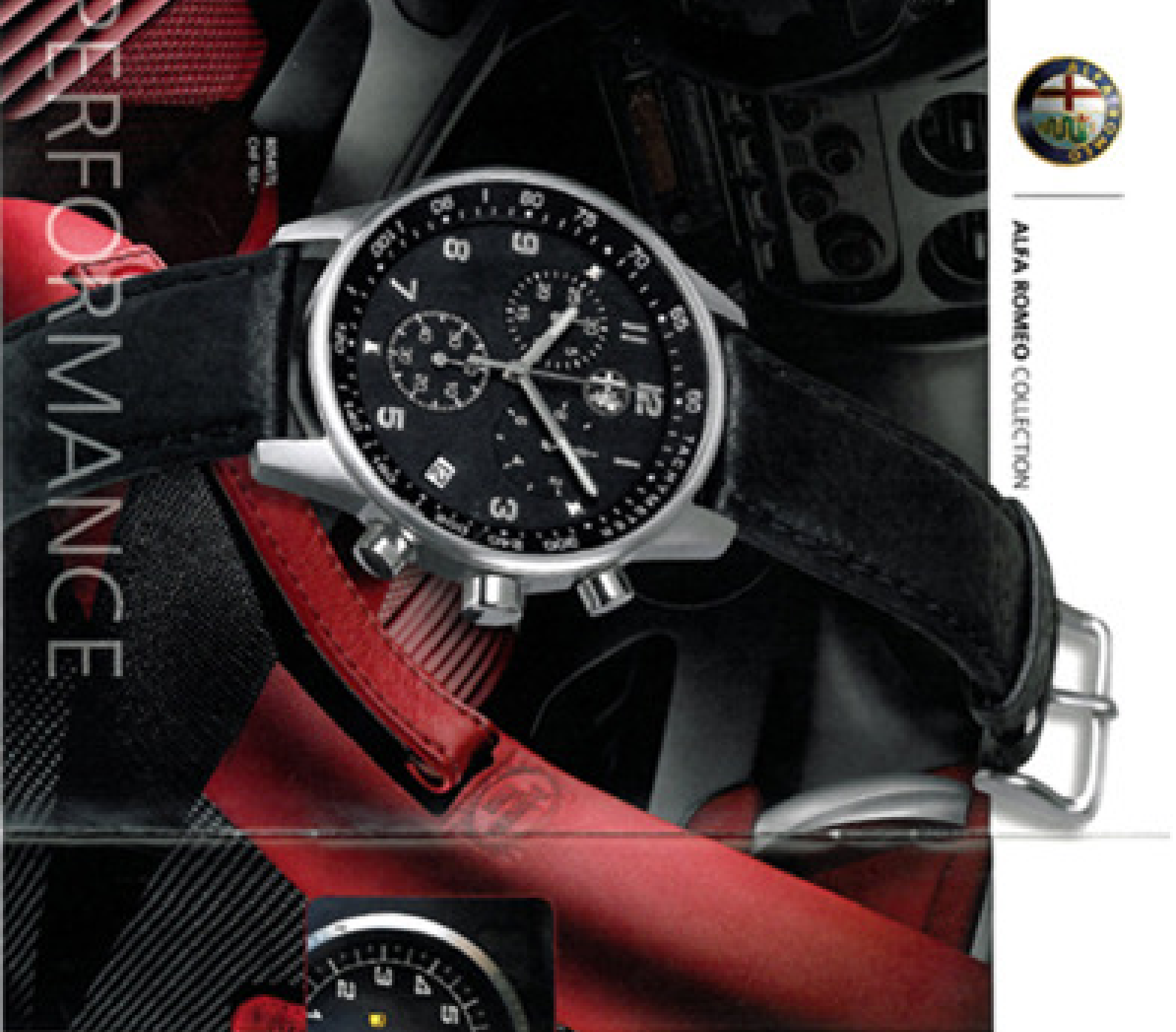
ROMEO COP 101.-